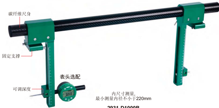
内尺寸测量, 最小测量内径不小于220mm